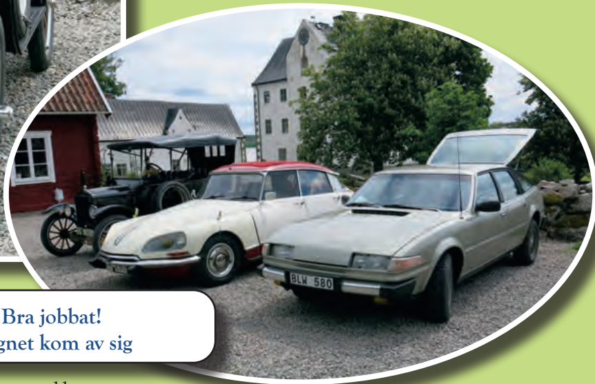
Bra jobbat! Regnet kom av sig