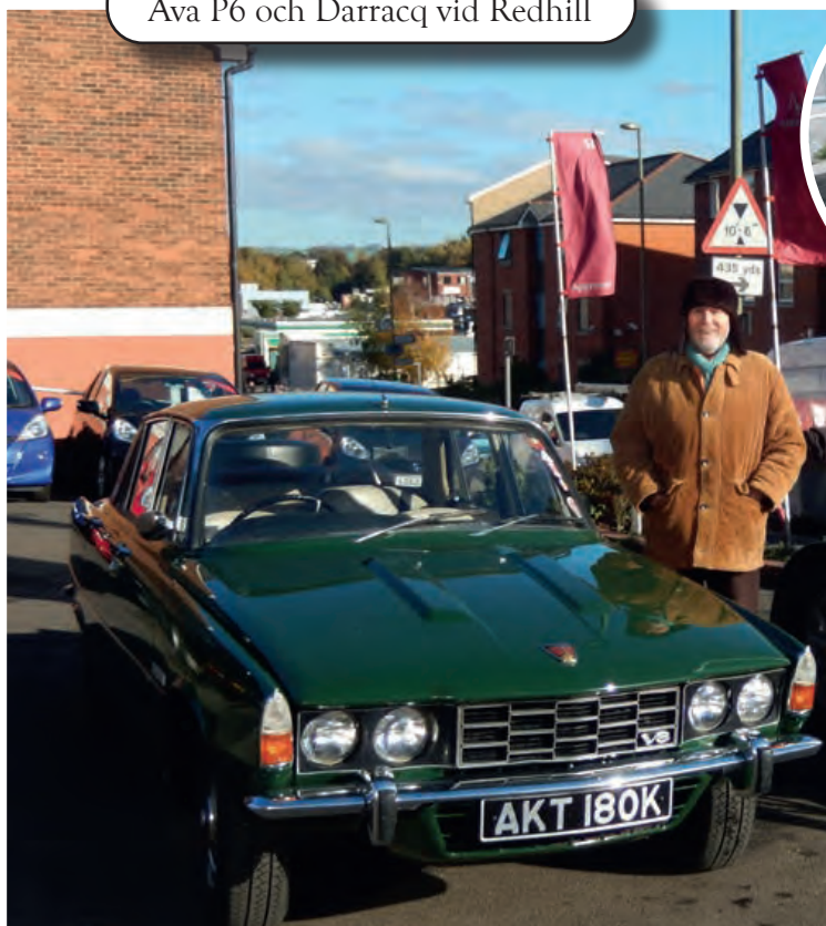
Ava P6 och Darracq vid Redhill