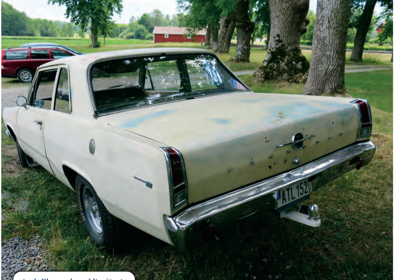
Axels Plymouth stod lite för sig