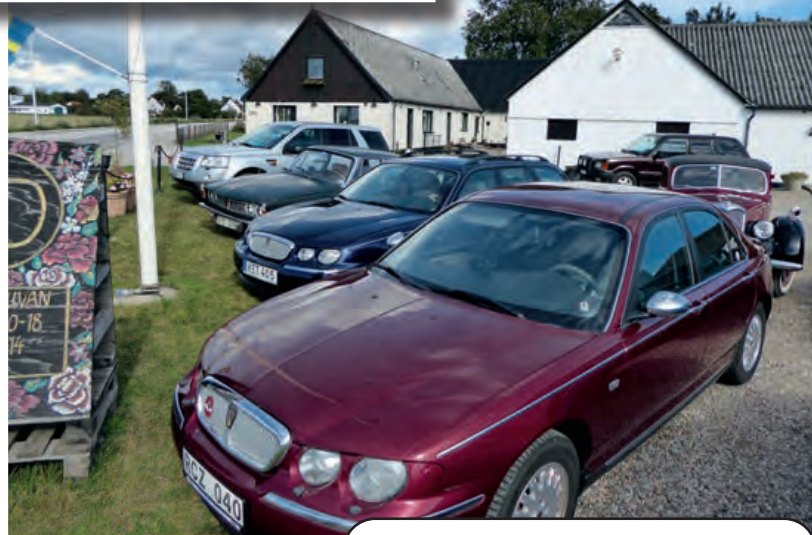
Gott o blandat Engelskt