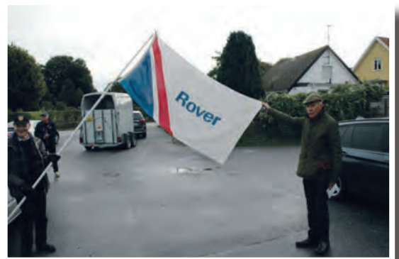
Flaggar för fika med Rover