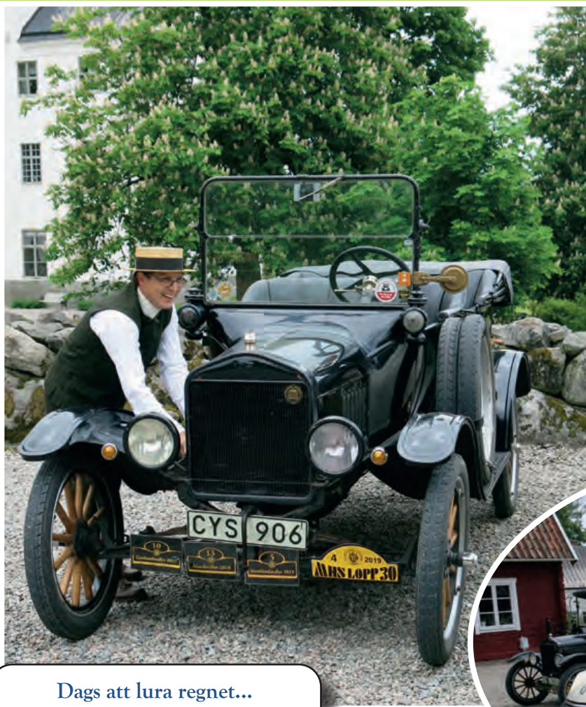
Dags att lura regnet... Upp med suffletten!