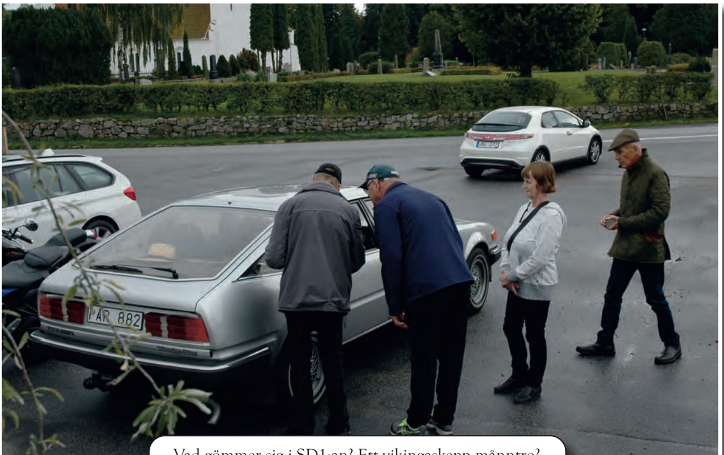
Vad gömmer sig i SD1:an? Ett vikingaskepp männtrö?