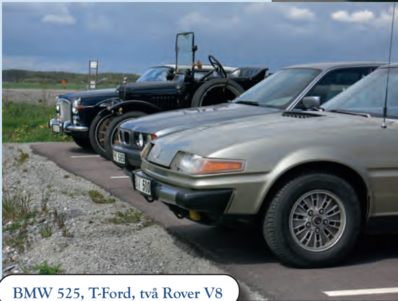
BMW 525, T-Ford, två Rover V8