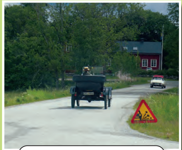
T-Ford tvåa och Citroën näst sist...