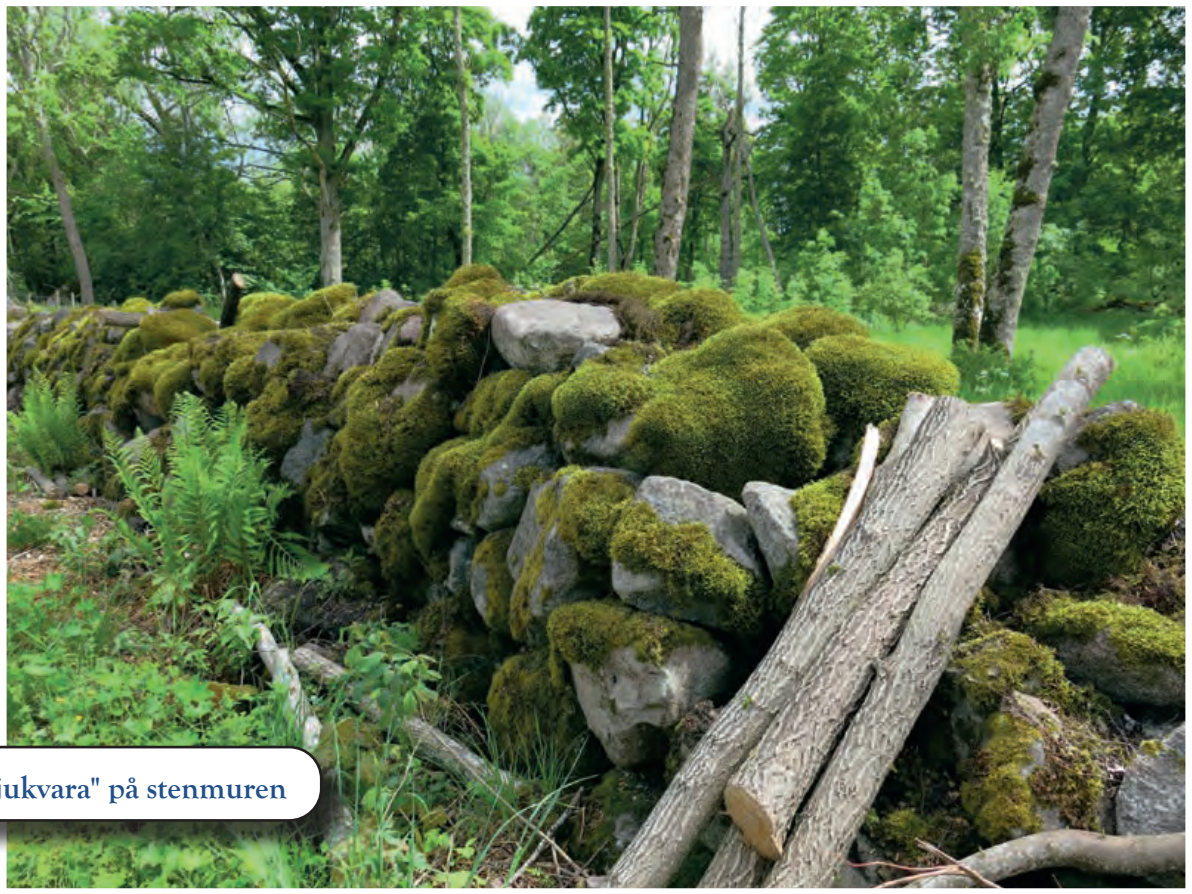
Grön "mjukvara" på stenmuren