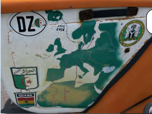
En berest 2CV - Island x 2, Algeriet, Ghana, med mera

Eftersom vi började bli fikasugna satte vi fart mot Forsby Kvarn Kafé.