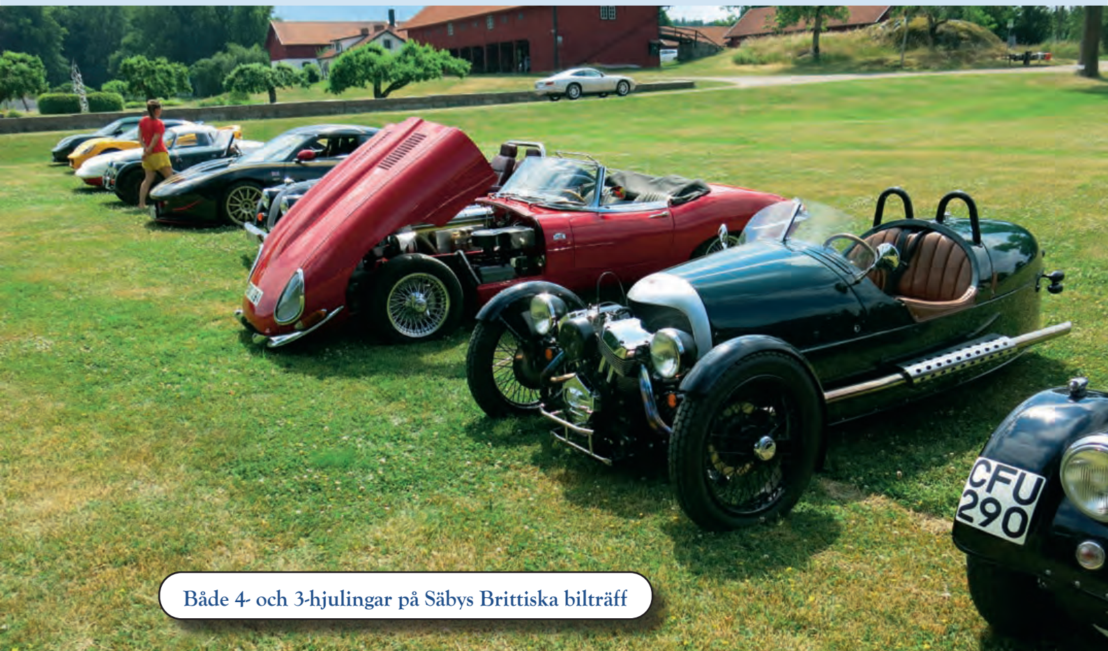
Både 4- och 3-hjulingar på Säbys Brittiska bilträff