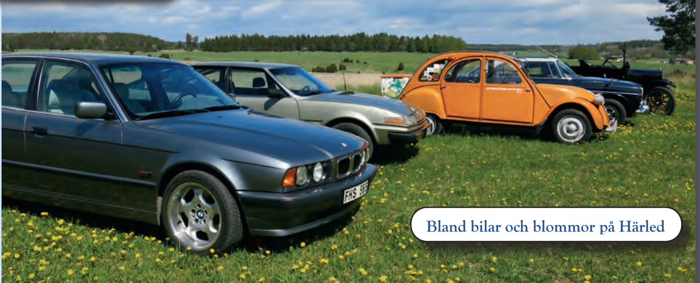
Bland bilar och blommor på Härled