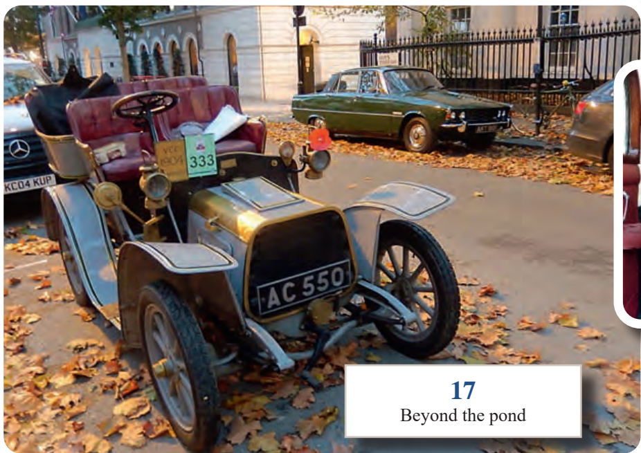
17 Beyond the pond