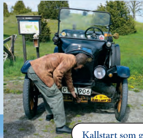
Kallstart som ger värme