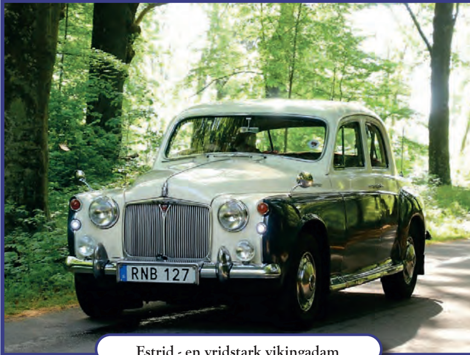
Estrid - en vridstark vikingadam

Attans vad det var mysigt att åka runt i ett väldoftande ”engelskt bibliotek” med fräscht skinn och fint sidenmatt trä.