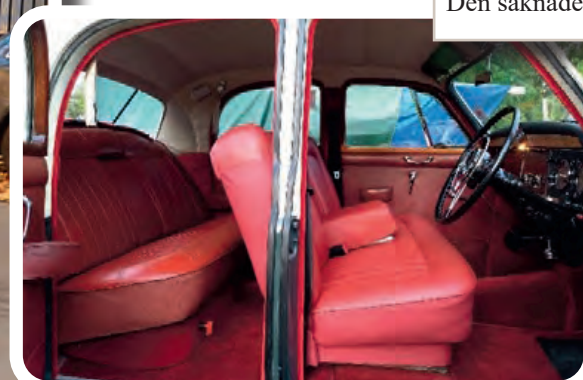
18 Den saknade bilen